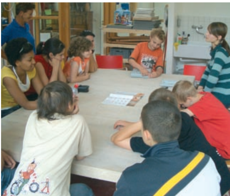
Bei intensiver Bastelarbeit sammelten die Kinder Kraft und Energie für den Kampf gegen ihre heimtückische Krankheit.

→ Etwas verunsichert betrat ich das Camp. Am Eingang las ich die Begrüßung im Infokasten: „Hier schaut keiner, wie wir aussehen, da hier alle das gleiche durchgemacht und viele ihre Haare verloren haben.“ Da wusste ich sofort, dass Mitleid hier nicht das war, was man von mir erwartete. Meine Aufgabe bestand an diesem Tag darin, die Kinder positiv zu motivieren und ihr Selbstbewusstsein zu stärken. Und ich wollte in ihnen den Glauben an ihre Möglichkeiten und Fähigkeiten verstärken. Sie sollten nach diesem Tag wirklich stolz auf sich sein, darauf, etwas ganz Besonderes geleistet zu haben.