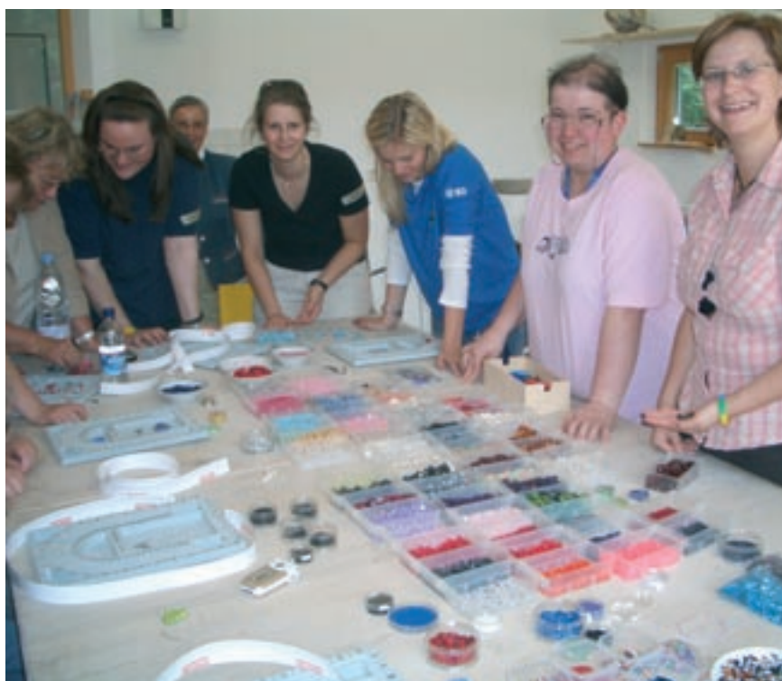
Die wunderschönen Perlen für dieses Wochenende wurden kostenlos von der Firma www.Beads-n-more.de zur Verfügung gestellt.